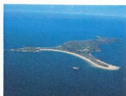
Île de Houat