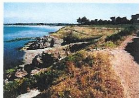
Sentiers des Douaniers