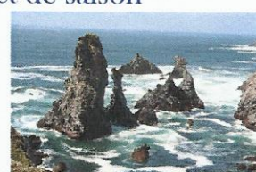
Aiguille de Port Coton

Côté Prix : 543 €/personne -5% remise FFRP = 515.85 € / personne